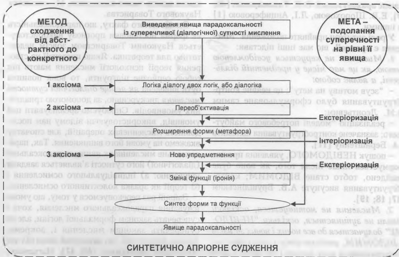
Рис. 2. Функціональна модель парадоксального мислення

доведено [46; 47], для складних явищ діалогічної сутності мислення, таких як метафори́зація та іронізування, цими умовами є наявність суперечності між тим, що означається, і тим, що мається на увазі [46; 47]. Не становить виняток і явище парадоксальності. Умовою його існування є переважно існування дилеми, котру можна сформулювати запитанням: чи є схожість між тим, що мислиться Автором, і тим, що він пропонує для розуміння Адресата? Виникає суперечність: з одного боку, схожість існує, а з іншого – її немає.