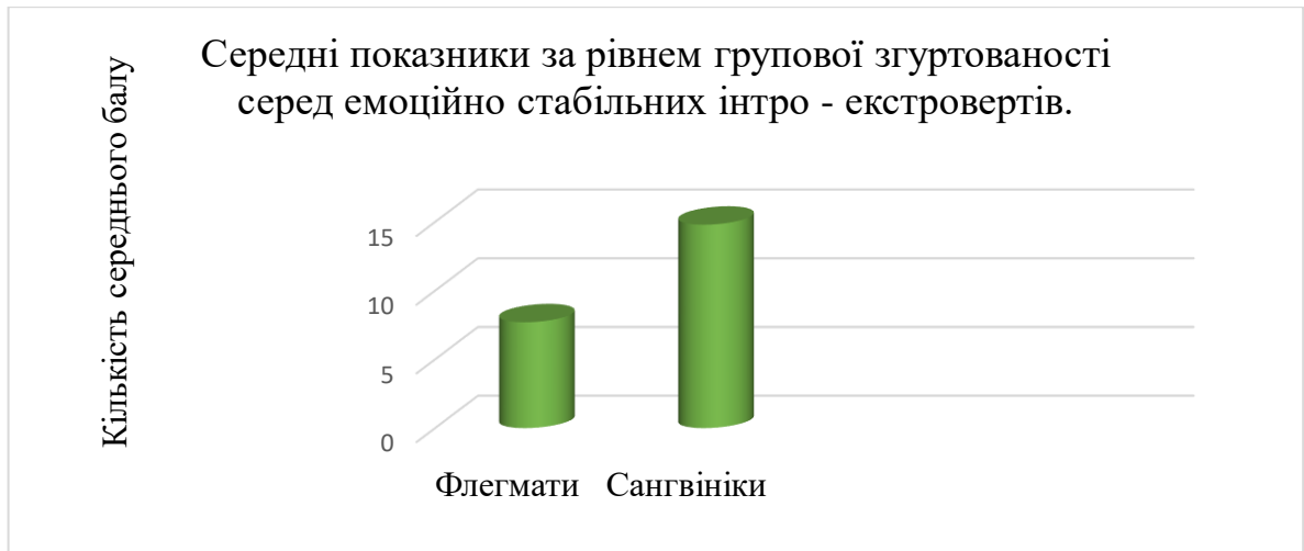
Рисунок 2 Середні показники результатів за методикою «Визначення індексу групової згуртованості» серед емоційно стабільних інтро – екстравертів.

екстрровертованих. Середнім показником групової згуртованості в емоційно нестабільних склав – 10,81 ( середній рівень групової згуртованості ). Але якщо розглянути окремо емоційно нестабільних інтро та екстравертів, ми побачимо такі результати: емоційно нестабільні екстраверти – середній показник у групі – 12,42 ( рівень групової згуртованості вище середнього ); емоційно нестабільні інтроверти – середній показник у групі – 9,2 ( середній показник групової згуртованості ).