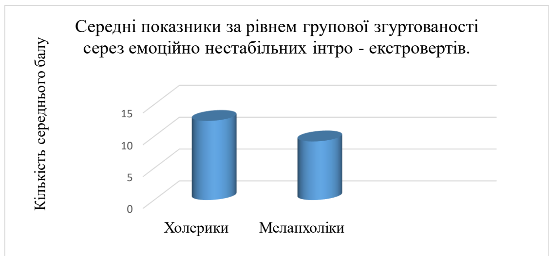
Рисунок 3. - Середні показники результатів за методикою «Визначення індексу групової згуртованості» серед емоційно нестабільних інтро – екстравертів.