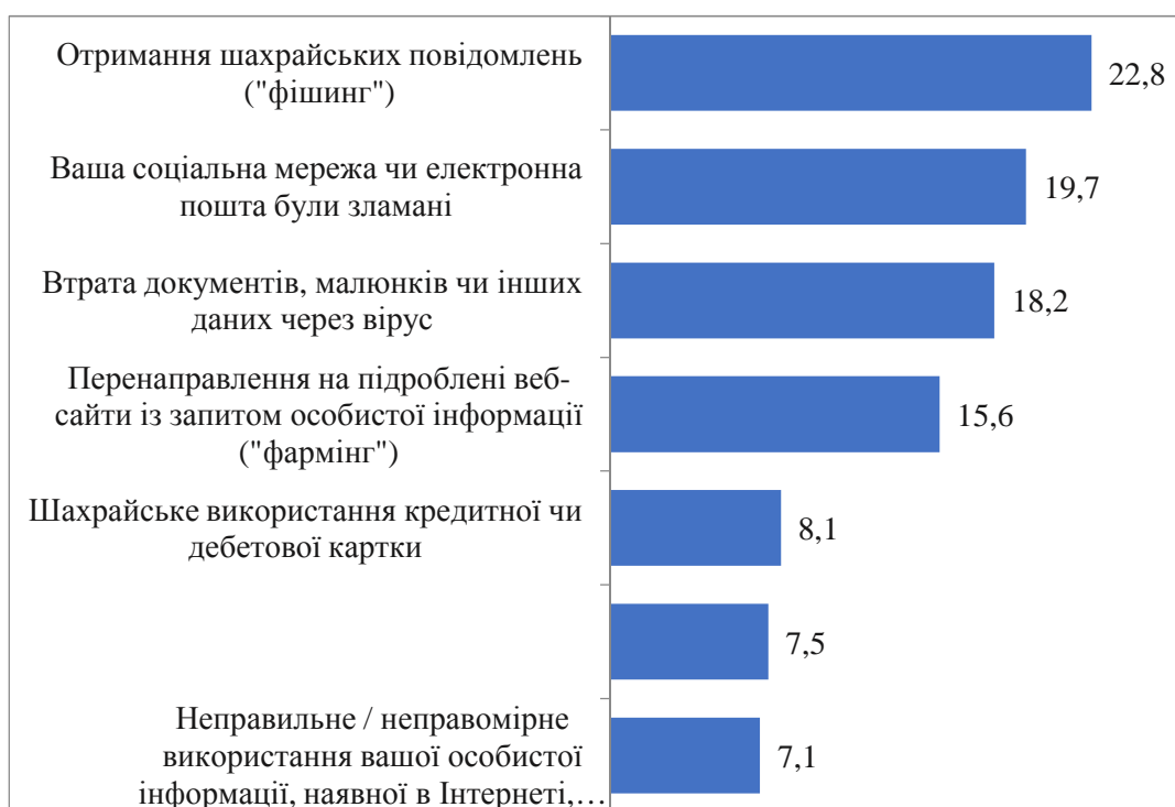
Рисунок 1. Небезпечні ситуації, з якими стикаються діти в Internet

На сьогодні постає дуже важливе питання інформаційно-психологічної безпеки, адже захоплення інформаційними технологіями та відсутність необхідних навичок прогнозування ризиків у мережі може стати причиною небезпечних ситуацій у реальному житті, а саме насилля.